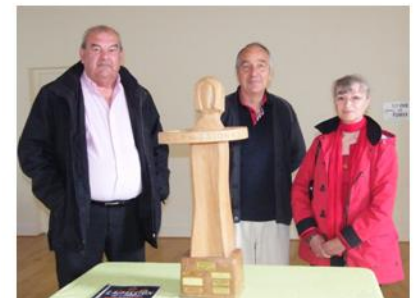
La délégation loudéacienne de retour d'Erl